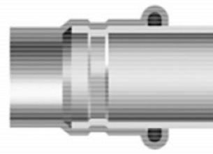
Przekrój połączenia po zaprasowaniu